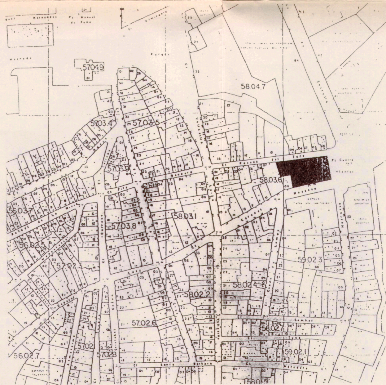
SITUACION ( E:1/2000)