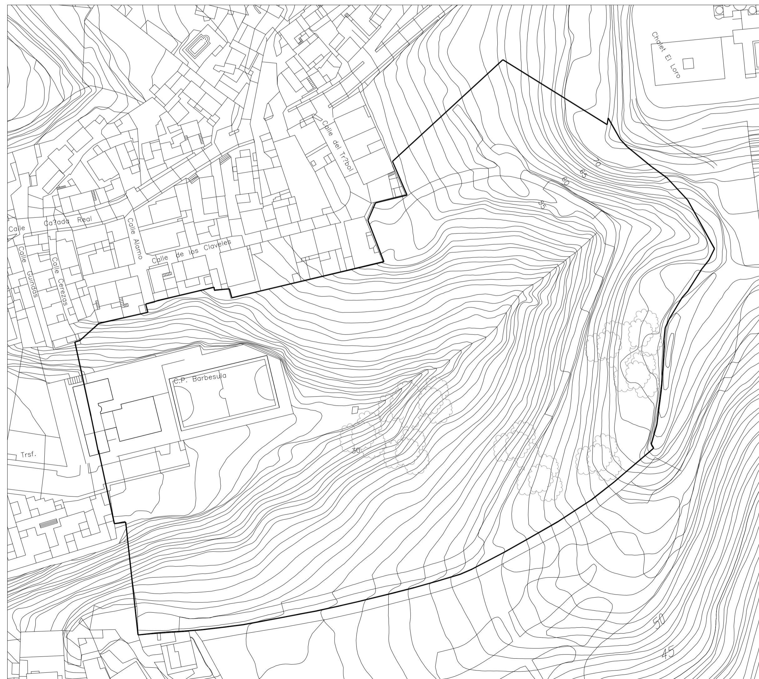
ESTADO ACTUAL DE LOS TERRENOS 1/1000