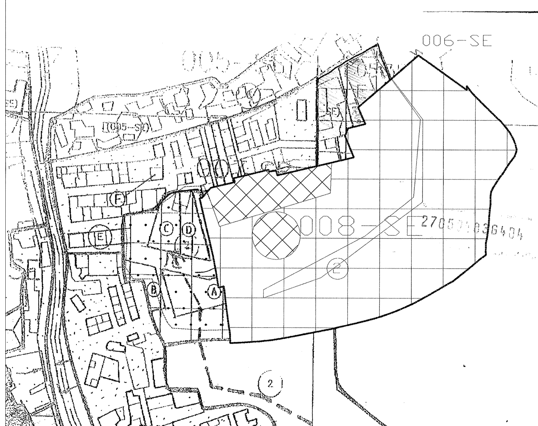
SITUACION RESPECTO CLASIFICACION PGOU 1/2000