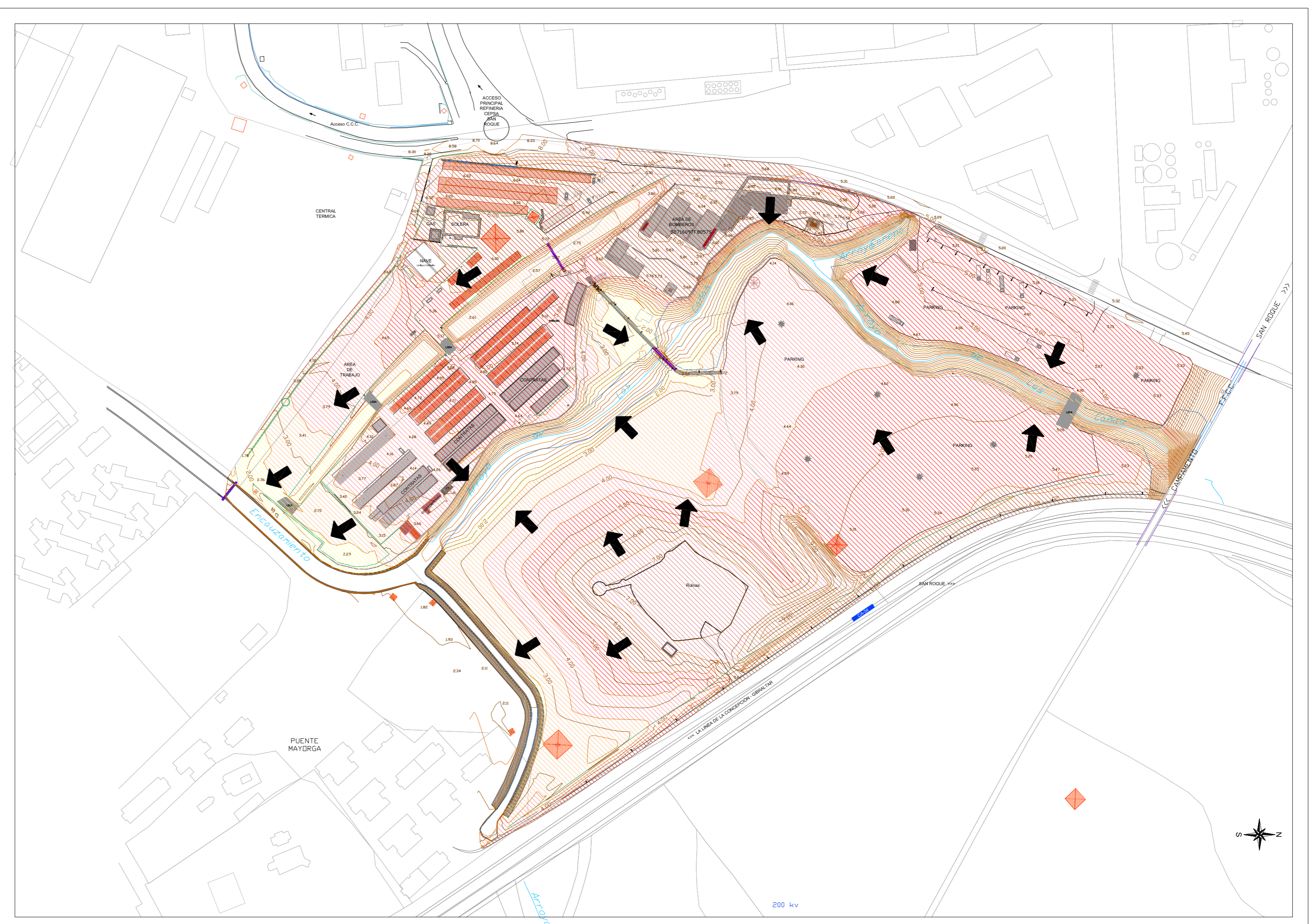
PLANO HIPSONMÉTRICO Y CLINOMÉTRICO